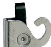
Crochet avec verrou